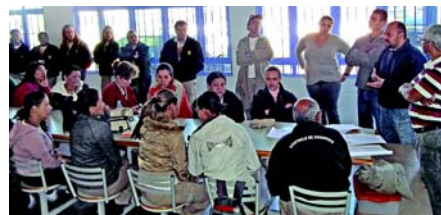
Diretores durante reunião na Zoonoses