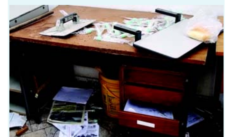
TAVA MAL - Assim encontramos a sede do Sindicato em 2006

Pedro - Pedro diz: "Quando uma categoria cresce e avança precisa de mais estrutura e mais suporte. É o que queremos com a nova sede".