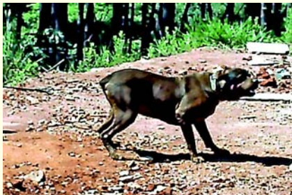
Pitbull faz segurança em obra de escola

Outra questão: por que a Proguaru não solicitou um Guarda Civil Municipal (GCM) para fazer a segurança do local. Até porque entre as funções do GCM está a de zelar pelo patrimônio público, que são os espaços (como parques, secretarias e outros) da Prefeitura.