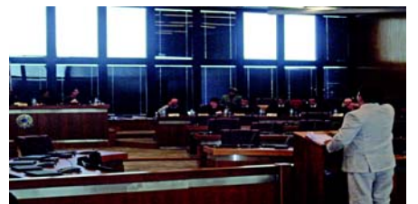
Advogado do Stap no TRT, dia 26 de outubro

Em audiência dia 26, o Tribunal Regional do Trabalho (TRT), em São Paulo, julgou abusiva a greve parcial dos Servidores da Saúde em julho.