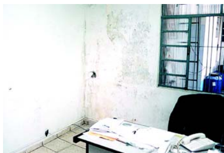
Remendos já não resolviam mais

Quando a atual diretoria assumiu o Stap, em fevereiro de 2006, ela encontrou uma sede arruinada. O que foi possível reformar foi reformado. Mas a velha estrutura dificultava ampliações e melhorias reais.