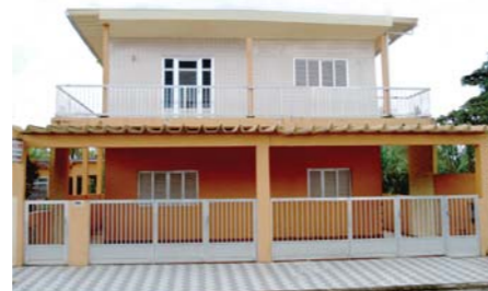
Colônia fica na rua Humberto da Silva Piques, 118, Jardim da Praia. Próximo ao Sesc

Reservas - Na sede, a partir do 1º dia útil do mês anterior ao da hospedagem. É necessário apresentar carteirinha de sócio ou último holerite e nome completo dos